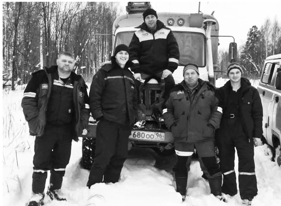
Бригады распределительных сетей Байкаловского РЭС принимали участие в крупных командно-штабных учениях в Челябинской области.

Продолжая внедрять новые технологии и материалы, произвели замену воздушного провода на СИП (самонесущий изолированный). Занимались механизированной расчисткой трассы от кустарников. Благодаря технике получилась гораздо эффективнее.