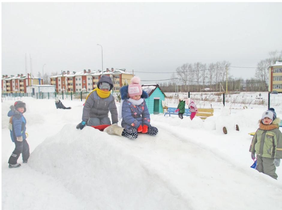
В детском саду жизнь бьёт ключом. Ребята получают всестороннее развитие.

Сейчас все страхи позади. Детский сад посещают 157 ребят в возрасте от полутора до семи лет включительно. К нам их привозят