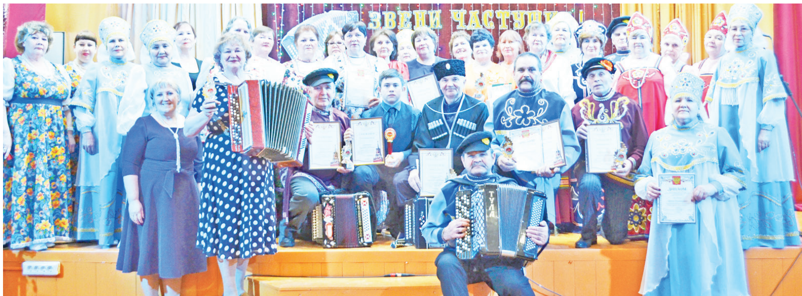
Яркий самобытный фестиваль «Играй, гармонь! Звени, частушка!» собрал в Баженовском ДК гармонистов, частушечников и зрителей, объединённых любовью к певунье-гармошке, к музыкальному и песенному наследию наших предков.

Тёплую душевную атмосферу праздника постарались создать на сце-